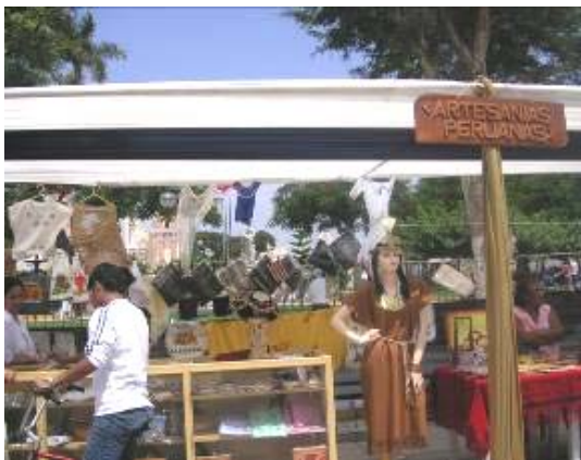
Artesanías Peruanas en Ferreñafe