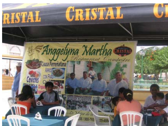
Festival gastronómico Ferreñafe

Para la Municipalidad Provincial y la USMP este proyecto constituye una estrategia de trabajo importante para vincular de manera efectiva la educación, especialmente la universitaria con los procesos de desarrollo que aportan a la competitividad de las regiones y del país. Además, es la primera vez que la transferencia metodológica es responsabilidad de un equipo local liderado por el IPPEU y certificado por mesopartner .