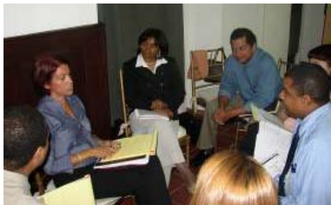
Capacitación de paquistas dominicanos en 2003

más se han entusiasmado son los grupos empresariales, particularmente cuando se dieron cuenta de que a través de su propia iniciativa en equipo pueden acceder a nuevos mercados, fortalecer su posición en mercados existentes, aumentar sus ventas y mejorar la productividad en su sector en conjunto. Con algunas excepciones, los actores públicos, particularmente a nivel local, aún no se han enganchado a los procesos de la manera esperada.