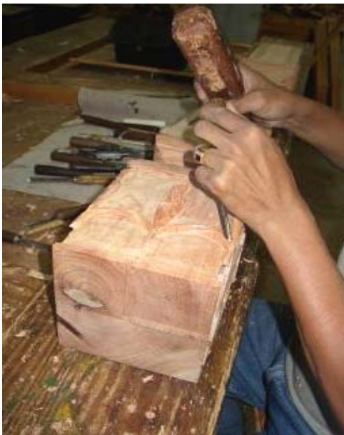
Trabajo en ornamentos de muebles

en Burende y en Santiago para suplir órdenes de compra. Este éxito incentivó a otros fabricantes y a una empresa de decoraciones a montarse al barco. Uno de los empresarios empezó a convencer a los demás del sector para que se organizaran y establecieran la Asociación de Fabricantes de Muebles de Burende (AUFAMUBU) que actualmente tiene 12 miembros y está promoviendo y