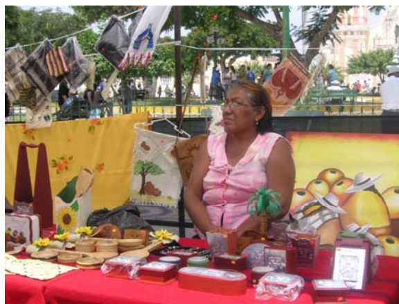
Productos artesanales en Ferreñafe

En síntesis, el proyecto propone, después de la transferencia de la metodología PACA a los 20 agentes económicos públicos y privados de la zona, realizar el diagnóstico y la formulación de planes de desarrollo de la competitividad en dos distritos, uno principalmente rural y otro urbano de la provincia.