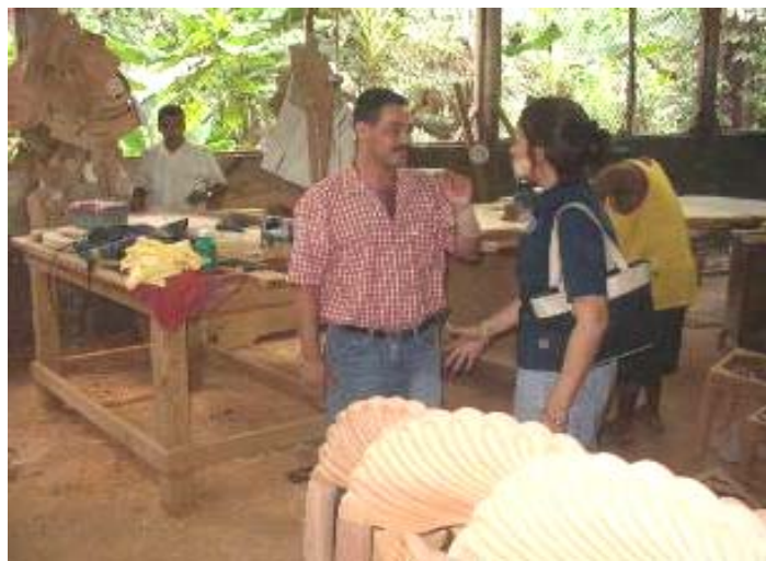
Visita de una fábrica de muebles, Burende, Rep.Dom.

más de 200 miembros durante este tiempo (corresponde al 70 por ciento del total del sector). Actualmente, ASOCACONST tiene una estructura organizacional consolidada y una junta directiva aceptada y activa. Con mirada hacia el futuro, está actualmente explorando nuevas oportunidades de negocios para sus socios, tal como brindar el transporte al turismo de excursiones (safaris) hacia las reservas naturales en el territorio.