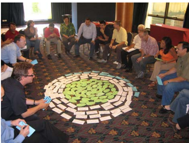
Isla de aprendizaje en la “AdV” en Buenos Aires