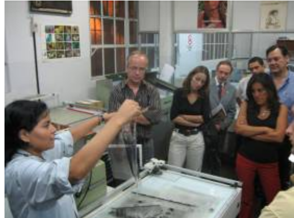
Visita en la Fundación Gutenberg